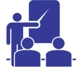
Yhteysopettajakoulutus ja vaikuttamisseminaari