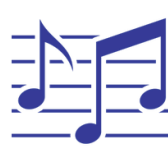
Kivaa ja korkealta - UIT revyy