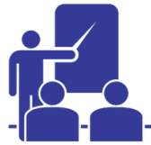
Eläkkeelle siirtyvien tilaisuus