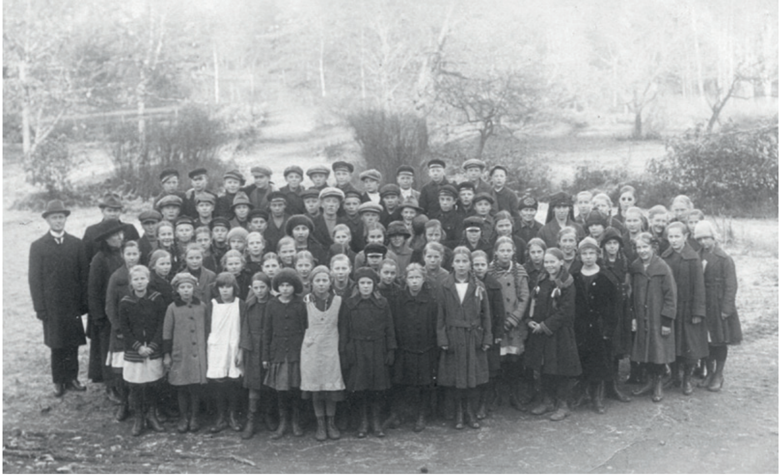
OPETTAJIA JA KANSAKOULULAISIA VUONNA 1920.