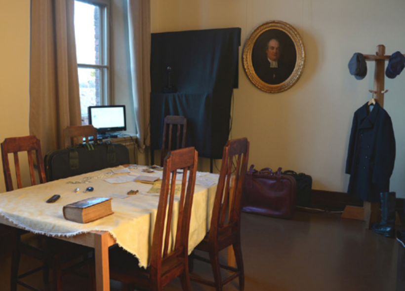
Opiskelijoiden rakentama vuosi 1918 -teemainen valkoisten pakuhuone Jyväskylän yliopistolla, 2018.