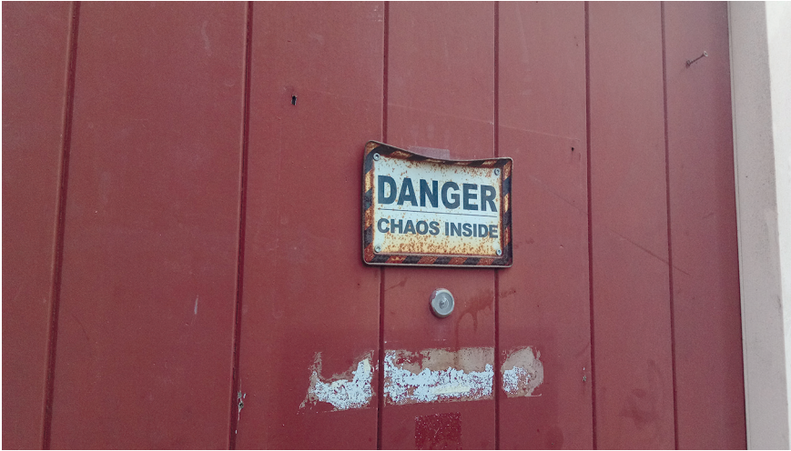
DONALD TRUNG QUOC DON (CHỮ HÁN: 徵國單), A LOCAL SIGN WARNS PEOPLE THAT IT IS CHAOTIC INSIDE IN THE GRONINGER CITY OF WINSCHOTEN, OLDAMBT 2020 WIKIMEDIA COMMONS, WIKIPEDIA NO FAKE NEWS.