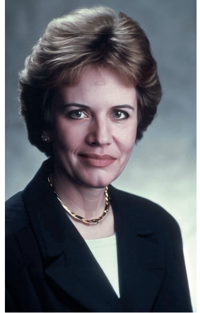
BORN ISOPOD, AI-GENERATED IMAGE OF A WOMAN. 2023 HTTPS://LABS.OPENAI.COM/

kraattisten valtioiden heikkouksia on hyödynnetty. Tässä länsimaita on hämmentänyt toimintojen kiistettävyys ja disinformaation levittäminen.