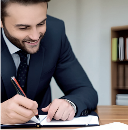
LUSYE11, AI-GENERATED IMAGE OF A MAN. 2023 HTTPS://THEWORKMASTER.COM