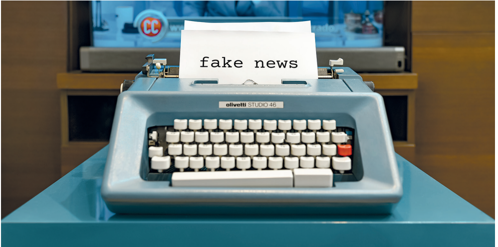
OLIVETTI STUDIO 46, 2021