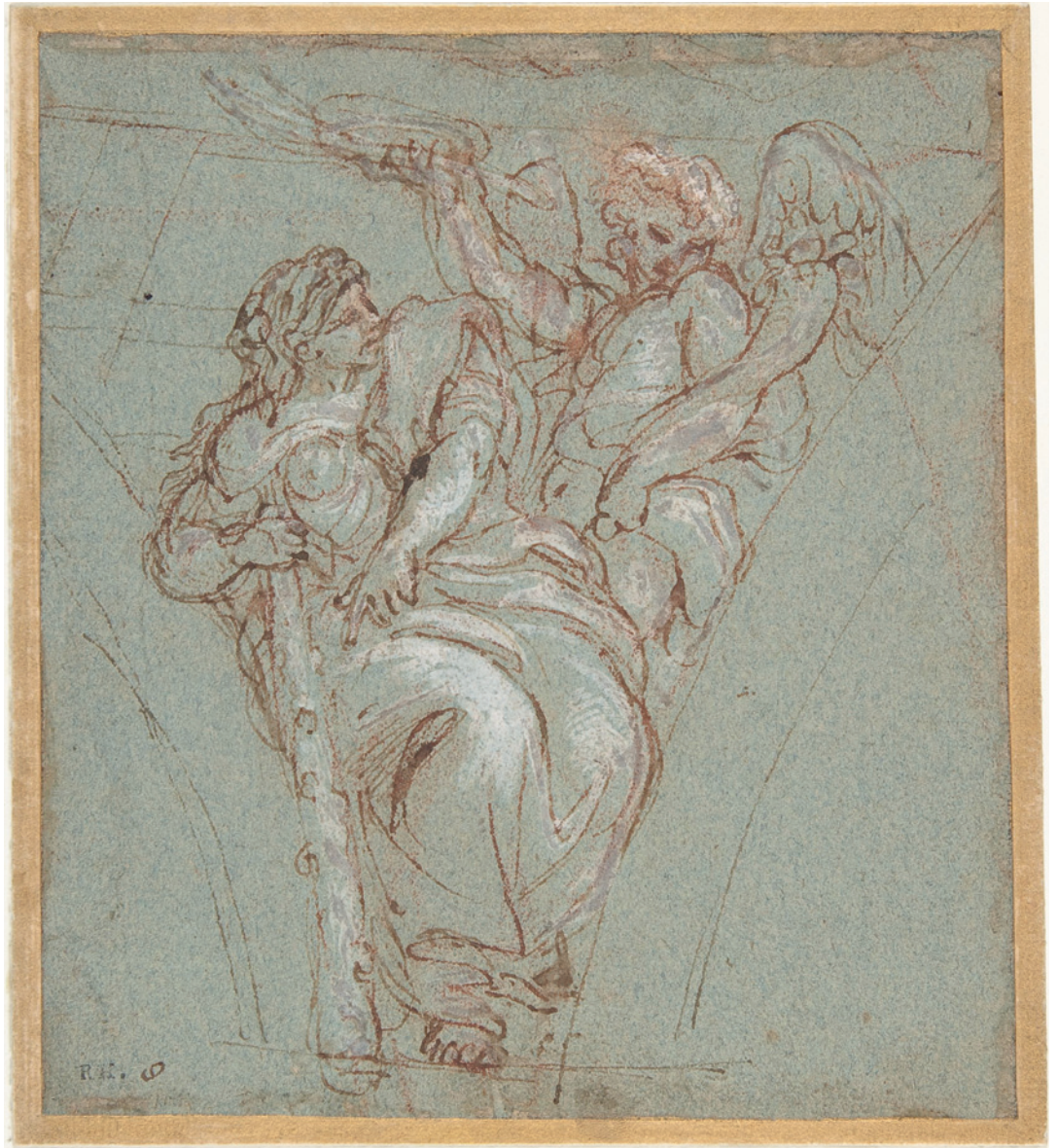
KUNNIA KRUUNAA HYVEEN, 1670-76. CARLO MARATTI (1625-1713). METROPOLITAN MUSEUM OF ART, WASHINGTON D.C.