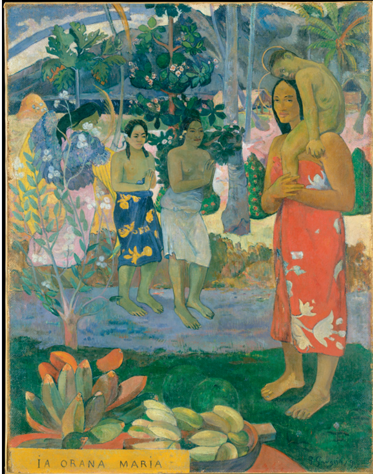
PAUL GAUGUIN, IA ORANA MARIA (TERVE MARIA) 1891. ATUONA, HIVA OA, MARQUESASSAARET METROPOLITAN MUSEUM OF ART, WASHINGTON D.C.